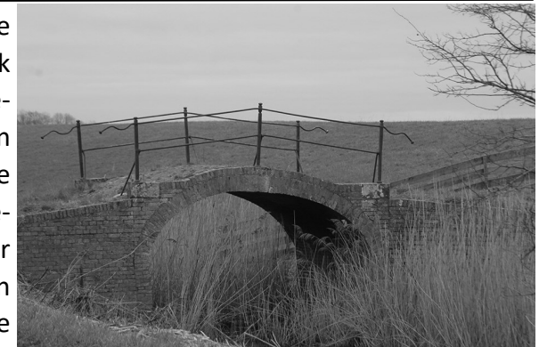
Brechje by Kommersyl

get no sa'n dyk yn de rjochting fan Pietersyl. Ik sjoch in hiel âld skilde-reftich brechje. Fêst ek in monumintsje. Lâns dizze wei steane wat mear boerepleatsen. It wurdt hjir wat lytsskaliger. Oan myn rjochterhân leit no earne de Lauwers. Dy streamt der midden troch it boere-